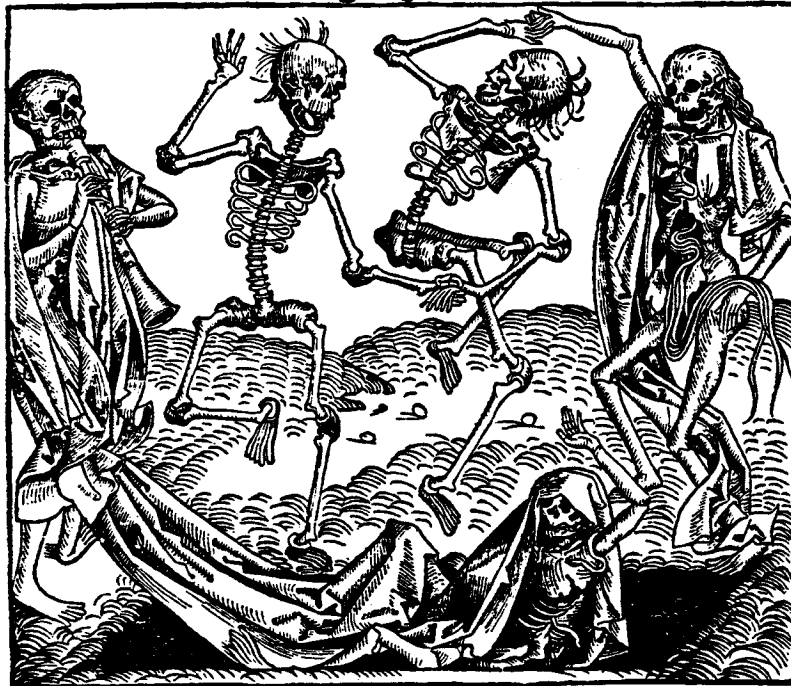
Totentanz der Schedelschen Weltchronik. (Nürnberg 1493)